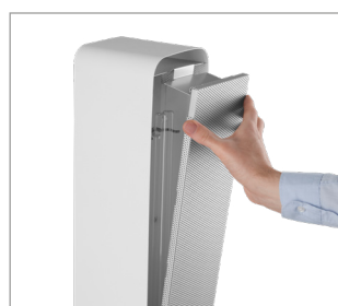
Zdjęcie przestony umożliwia bezpośrednią dezynfekcję powierzchni.