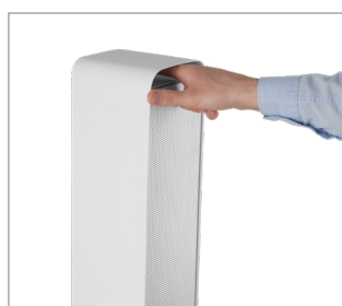
Wygodny uchwyt otwierający oraz otwór do przenoszenia lampy.

Po otwarciu przestony źródła światła wystarczy skierować lampę bezpośrednio na powierzchnię przez określony czas, aby skutecznie ją zdezynfekować. Należy jednak pamiętać, że światło UV-C jest szkodliwe dla skóry i oczu. Wykorzystując lampę w tej formie nie można znajdować się w zasięgu strumienia światła, a przed jej użyciem wymagane jest zapoznanie się z instrukcją obsługi dołączonej do produktu.